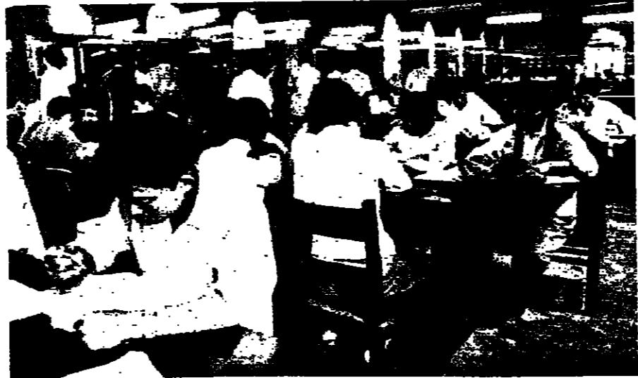
لعمادات عليية نسي مكتبة جامعية

اما التفرقة بالقرارات لارضة خصية في الصين . فانها اسفر عن ثلاث نماذج لغامق ، فلا بد ان يكون بطله اجنيا . اما اذا كشف امر البطلة المنجاة في قديم من قرانها وابناء قوما . من الصبب جدا ان ترى شاما بخامر فتاة صينية في الامم العاملة في الصين ، في الصينيا والسرح والحفلات الاجتماعية ، واذا وقع النظر على تلك فتكون المتجاوزان اجنبيين حينما الشيخة في اوربا أصبحت سلمة سلمة بمنزلة يستعملها اي اسرار ولاي غرض ممكن ، اما في الشرق فلا يزال مسطرا اقتناء السيارات الغربية ، وقد حصر ذلك في مسلاتي النقل العام ، كما استعصى بالدراجة تنقل الافراد في اعمالهم الخاصة . والغريب انه يتبع للبرسين فقط